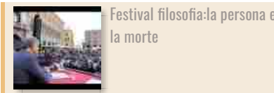
Festival filosofia: la persona e la morte

Home | Cronaca | Politica | Economia | Sport | Spettacoli | Tech | Gallery | Altre sezioni