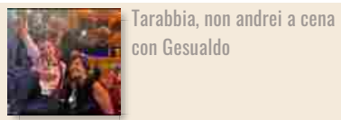
Tarabbia, non andrei a cena con Gesualdo